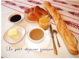
le petit déjeuner français