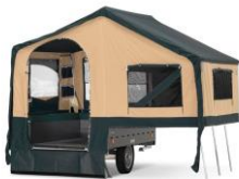
la caravane pliante