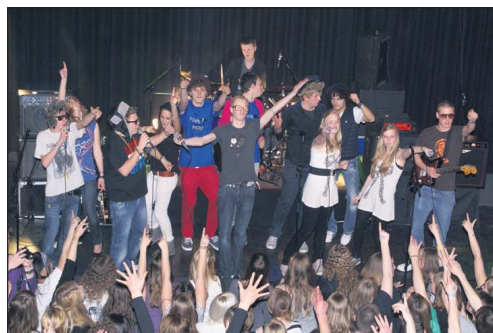
De muzikale winnaars vieren feest in de Bosuil

Van Horne Pop is morgenavond in muziekcentrum De Bosuil in Weert. Kaarten zijn nog te koop. Kijk op www.philipsvanhorne.nl voor meer informatie.